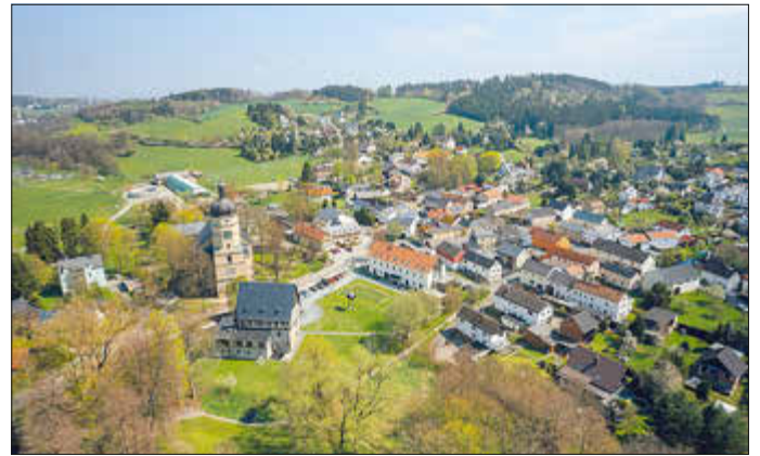
Blick auf Kürbitz

torischen Markt. Wer nicht nur übers Marktreiben schlendern möchte, kann vorher noch den Lindwurmpfad erwandern. So ist dann in jedem Monat bis Dezember eine Veranstaltung in Kürbitz geplant, bei der jeweils einer der Vereine der Hauptorganisator ist.