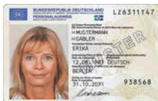
Bundesministerium des Innern und für Heimat

Ab Mai 2025 dürfen die Personalausweis- und Passbehörden biometrische Lichtbilder nur noch in digitaler Form verwenden. Ausgedruckte Lichtbilder in Papierform dürfen und können ab diesem Zeitpunkt nicht mehr von uns angenommen und verarbeitet werden.