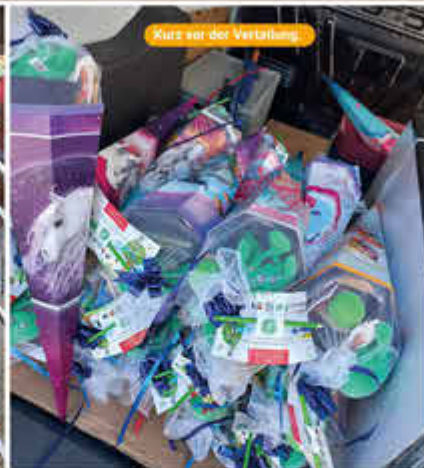
Kurz vor der Verteilung