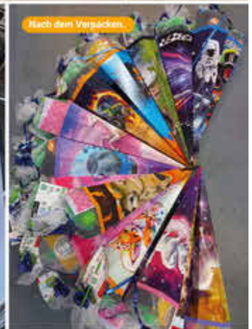
Nach dem Verpacken