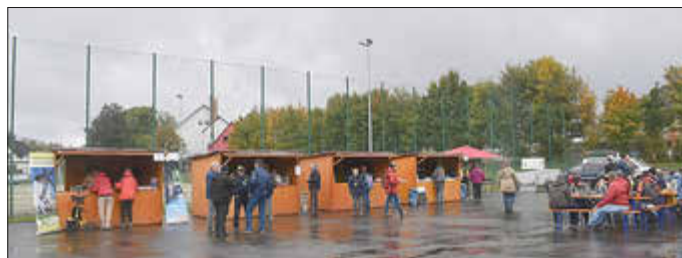
Am Ziel angekommen

Nachmittags am Ziel angekommen, hatte der Wettergott auch noch ein Einsehen und ließ es trocken bleiben bis Gegrilltes oder Kaffee und Kuchen verzehrt waren.