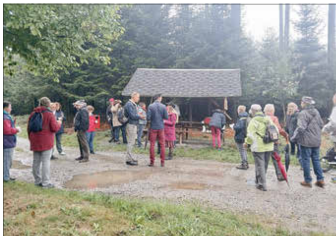
Einer der Kontrollpunkte

Spenden des Speckfetts, um die Wanderer an den Kontrollpunkten zu verpflegen und der Sonnenapotheke Tanna für das Bereitstellen der „Überlebenspäckchen“ zur Wanderung.